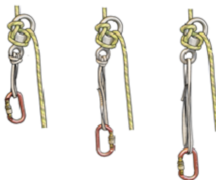
Animation du site CFC Dessin et graphique : Olivier Gola