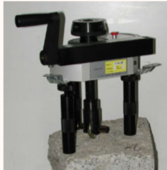
Vue d'ensemble de l'appareil

La nouvelle machine ci-dessous est le fruit d'une collaboration entre le Laboratoire d'essais de l'Ensa et la Société Dynatest