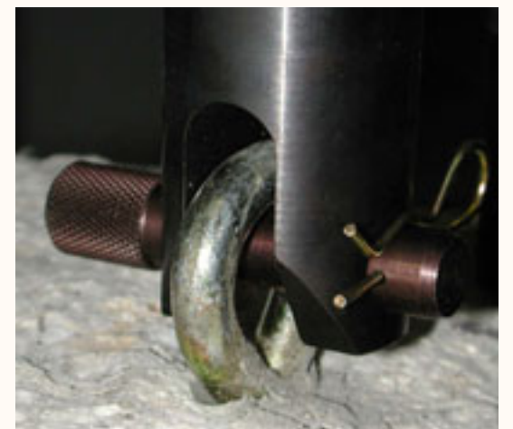
Détail du système d'accrochage sur les enclaves

Grâce à cette nouvelle machine, on peut désormais mesurer in situ la résistance à l'arrachement des enclaves.