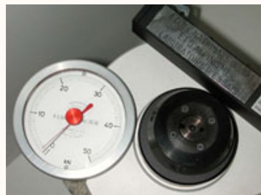
Détail du cadran d'affichage des mesures