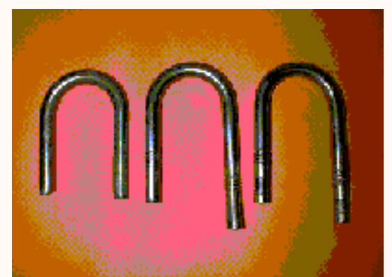
De gauche à droite 1ère, 2ème et 3ème génération

Pour ces trois générations de broches la partie qui dépasse du rocher est strictement identique, et il est impossible de faire la différence entre ces 3 modèles une fois qu'ils sont en place.