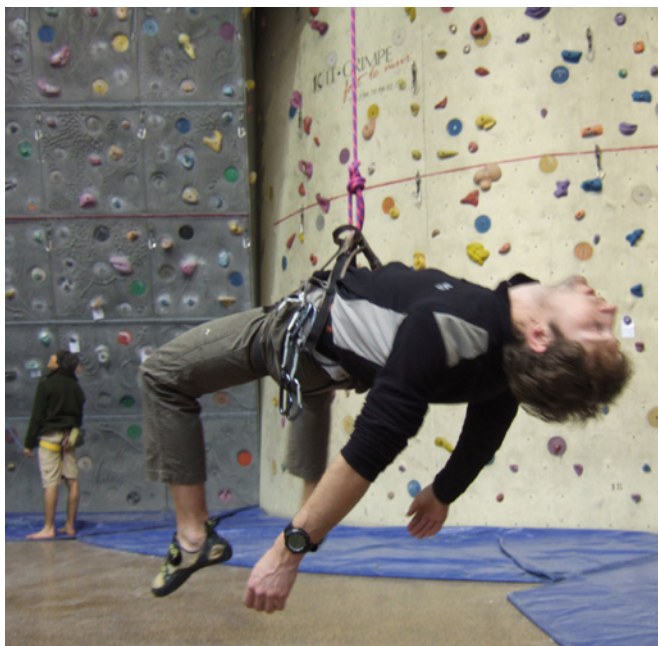
Victime d'un syndrome du baudrier. Il doit être décroché dans les plus brefs délais ! - Dr Reynaud.

permis d'isoler une série particulière de 15 spéléologues décédés sur corde sans que la cause du décès puisse être clairement définie [1,7] . Deux expérimentations ont été réalisées à Besançon sur des volontaires sains prouvant la rapidité d'installation du malaise : 6 minutes seulement pour la survenue du premier malaise avec perte de connaissance !